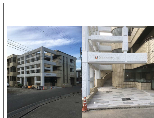
平成30年11月27日現在 内外装フルリフォーム中